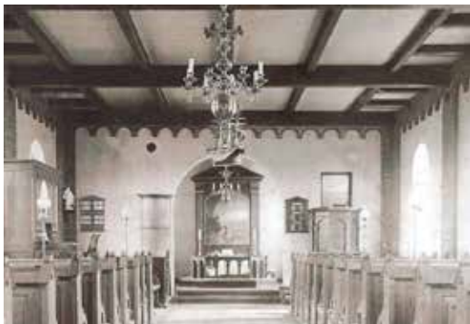
Hou kirke omkring 1900.