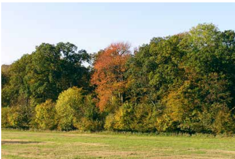
Bondegårdsskoven i Nr. Longelse.

Efter dagens gøremål lader vi roen falde på os ved en kort uformel gudstjeneste med kendte aftensalmer og en kort prædiken.