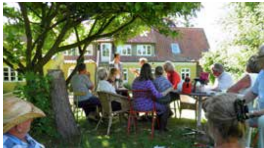
Kirkekaffe efter Michaels afslutningsgudstjeneste, hvor menighedsrådet holdt taler.