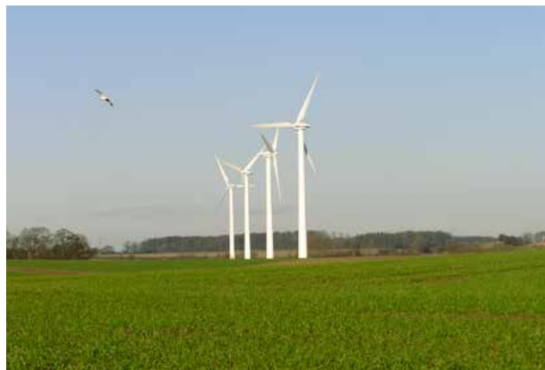
Vindmøller på Midtlangeland.