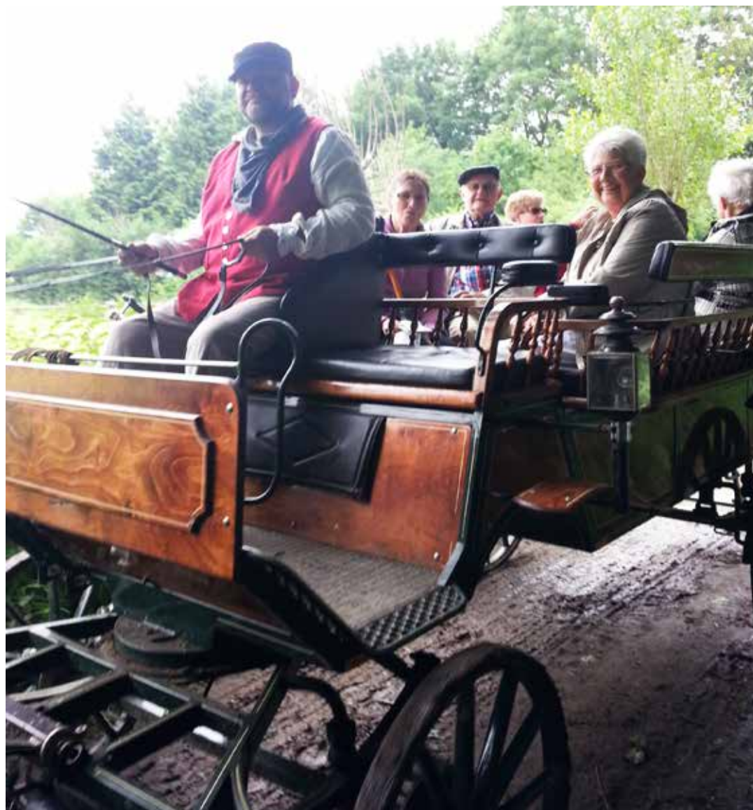
Nogle gik til fods, andre gik til hest

Skal du konfirmeres i foråret 2014? Hvis du går på Ørstedskolen eller Magleby Friskole får du brev fra din præst om mødetid og -sted for forberedelsen. Går du i skole et andet sted skal du selv kontakte præsten og aftale nærmere. Forberedelsen starter torsdag d. 29. august.