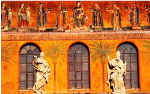
Mosaik fra 1140-erne på facaden af kirken Santa Maria i Trastevere i Rom