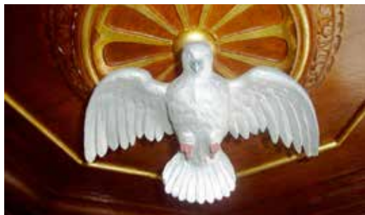
Helligåndsduen på lydhimmelen over prædikestolen i Tryggelev kirke.

Er nu i fuld gang med en gennemgribende renovering. Mange har spurgt, hvornår den åbner igen. Vi kan desværre ikke komme det nærmere, end at det bliver engang i foråret 2014.