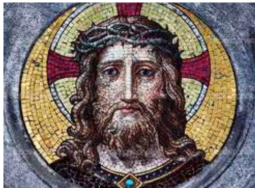
Mosaikbillede af Jesus af ukendt oprindelse