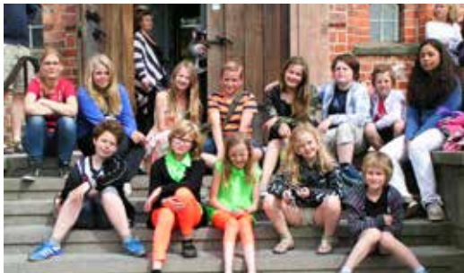
Kirkens børne-l ungdomskor sluttede forårsæsonen af med en hyggelig udflugt til Egeskov Slot.