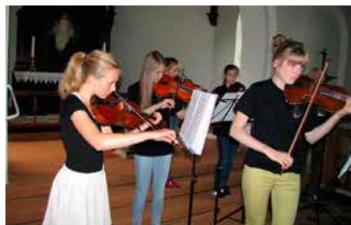
Koncert i kirken med ”Barokbanden” fra Svendborg Musikskole.

I sommerens løb har vi været så privilegeret at have besøg af bl.a. Sygehuskoret fra Rudkøbing og Barok-Banden fra Svendborg Musikskole (billedet). Der synes at være en stigende interesse for at benytte det flotte kirkerum og den gode akustik i Strynø Kirke til koncerter, og menighedsrådet har fremover valgt at prioritere musiklivet i kirken højt. Så hold øje med koncerter i kirken og hold dig endelig ikke tilbage, hvis du har forslag eller gode idéer til at berige musiklivet i kirken.