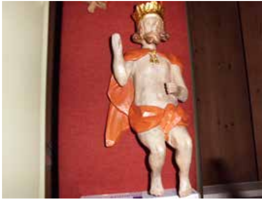
Kristusfiguren fra altertavlen i Longelse

sidste år med "Bogen", hvor han meget levende genfortæller de største beretninger i Bibelen. Skumringstimen vil også byde på musik og sang.