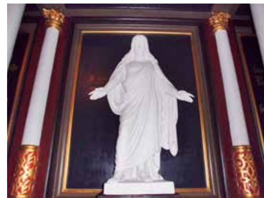
Thorvaldsens kristusfigur Longelse kirke

Vi inviterer til oplæsning af Bjarne Reuters genfortælling af Bibelen, som rummer både dramatik, indlevelse og humor. Forfatteren udkom