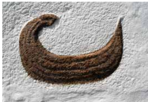
Skibsrelief på østgavlen af Bøstrup kirke, ca. 1100.

Ved en præsts fravær passes embedet af den anden sognepræst i pastoratet.