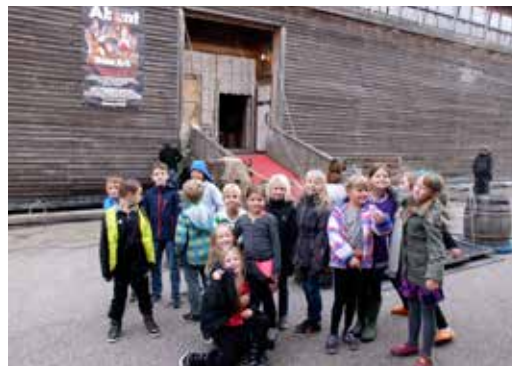
Juniorkonfirmanderne på besøg i Noahs Ark 23/10 2014

Vi har valgt, at forårets sognerejse skal gå til solskinsøen Bornholm. Vi har booket et dejligt hotel syd for Allinge med swimmingpool & wellnesscenter. Turen bringer os rundt på øen til rundkirker, Hammershus slotsruin, klipperne, Rytteknægten, den fantastiske sandstand ved Dueodde, de røgede sild, krøllebølleisen og alle de andre ting, som Bornholm har at byde på. Rejsedagene er fastsat til 25.-30. maj. Program for rejsen kan downloades fra kirkens hjemmeside www.longelsekirke.dk eller rekvireres i præstegården.