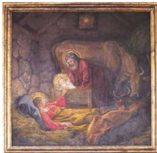
Joakim Skovgaard. Viborg Domkirkes loft 1912-1913 og derefter også Skagen Kirkes altertavle.

Og fordi det var den almægtige Gud, der blev menneske, så ophører fællesskabet med ham ikke der, hvor vi menneskers fællesskab med hinanden hører op. Ufred og død, får altså ikke det sidste ord. Det er det, som gør Jesus fødsel julenat til en helt særlig og enestående fødsel. Glorværdig som på billedet, som også ses i stort format på bladets forside.