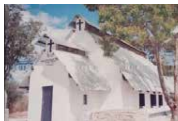
Kafubu: Før og efter