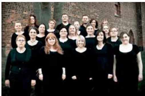
Able Gospel Choir.

Gudstjenesten kl. 16.00 den 30. november (1. søndag i advent) i Tranekær giver os mulighed for at synge en masse julesalmer sammen, så vi får øvet os på dem og indleder vore juleforberedelser. I år vil det være salmer, som bliver foreslået direkte af kirkegængerne og da gerne med en begrundelse. Det bliver efter princippet først til mølle, så tænk gerne på en salme hjemmefra, som du kunne tænke dig, vi skulle synge. Julesalmerne findes i salmebogen fra nr. 94-136.