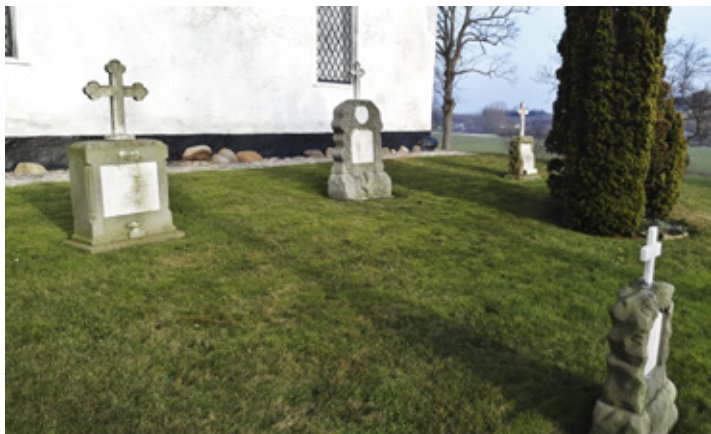
Kirkegårdsafsnit til urnebegravelser