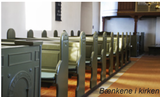
Bænkene i kirken